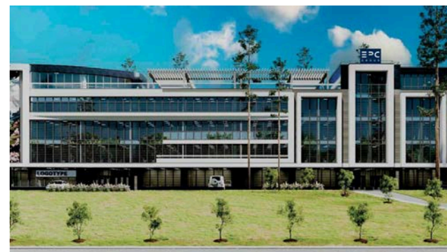
Бизнес-центр по улице Сахариева в г. Алматы