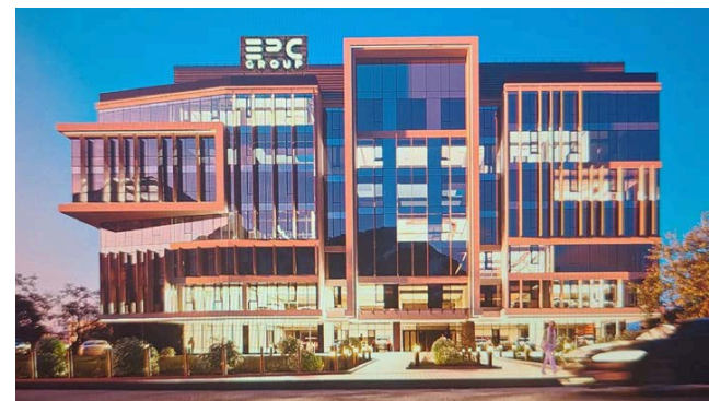
Бизнес-центр на пересечении бульвара Бухар Жырау и набережной Х.Нурғалиева в г. Алматы