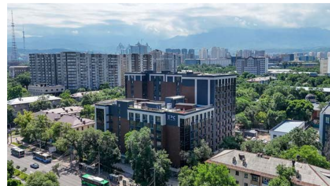
ЖК "Miracle" в г. Алматы