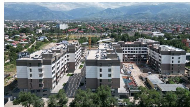
ЖК “Melody” в г. Алматы