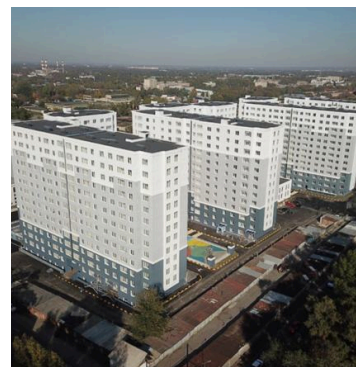
ЖК “Atlant” в г. Алматы