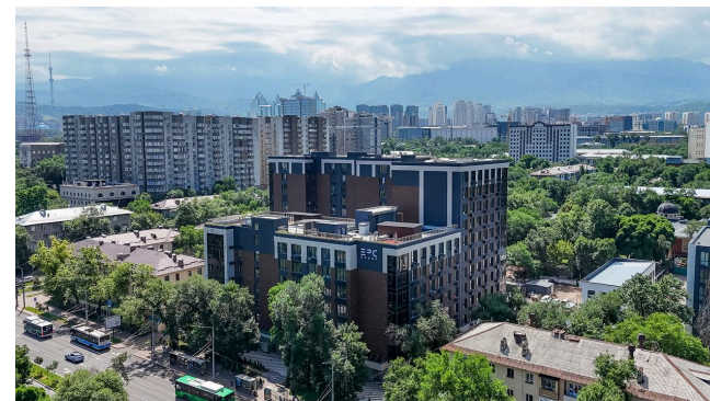
ЖК “Miracle” в г. Алматы