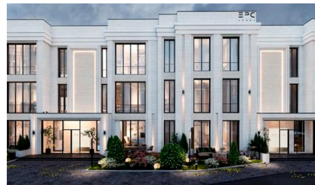
ЖК “Selin Residence” в г. Алматы

Все объекты соответствуют строгим требованиям сейсмоустойчивости.