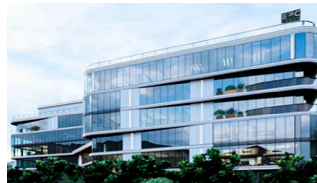
Бизнес-центр напротив ВОАД в г. Алматы

Все объекты соответствуют строгим требованиям сейсмостойчивости.