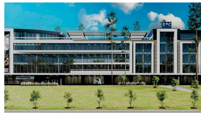
Бизнес-центр по улице Сахариева в г. Алматы