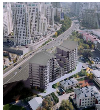
ЖК Тимирязева/ Сейфуллина в г. Алматы