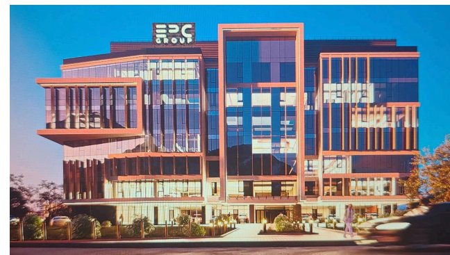
Бизнес-центр на пересечении бульвара Бухар Жырау и набережной Х.Нурғалиева в г. Алматы