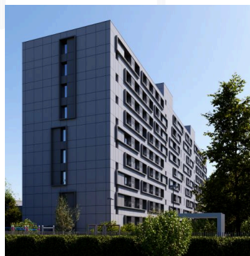
Студенческое общежитие для Satbayev University