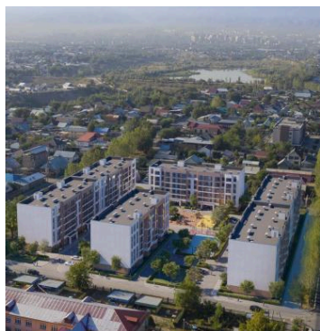
ЖК “Улжан” в г. Алматы